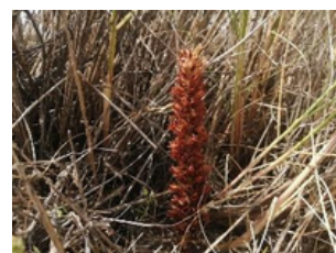
Волчья трава Сиде