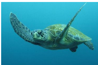
Зелёная морская черепаха