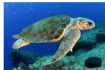
Логгерхед ( Caretta caretta )